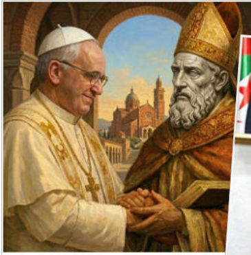
Sur les pas d'Augustin : le pape Léon attendu en Algérie

Pour les chercheurs ou pour approfondir vos connaissances sur l'Algérie à l'époque française, n'oubliez pas notre encyclopédie ( https://encyclopedia.cercalealgerianiste.fr/ ).