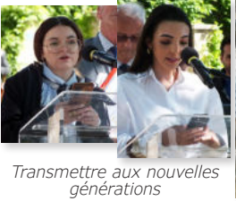
Transmettre aux nouvelles générations