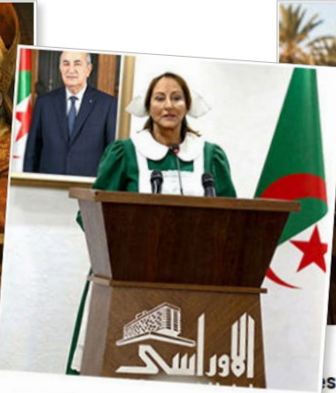
Les tribulations de Ségolène à Alger (ou la diplomatie de la contrition permanente)

Quelques uns des articles publiés dans la Newsletter du mois de mars