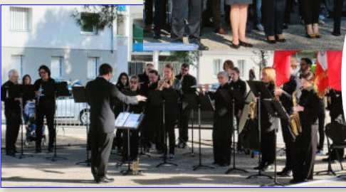
Cérémonie de Valence