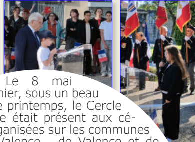
Cérémonie de Guilherand-Granges

Le 8 mai dernier, sous un beau soleil de printemps, le Cercle algérieniste était présent aux cérémonies organisées sur les communes de Bourg-lès-Valence, de Valence et de Guilherand-Granges.