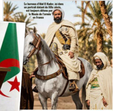
Patrimoine national. Restituer, restituer... Certains États voudraient-ils vider nos musées ?