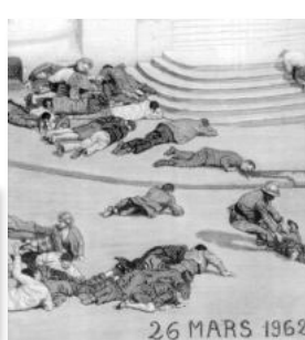
26 MARS 1962