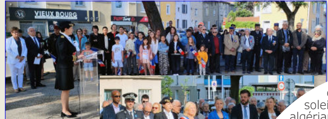
Cérémonie de Bourg-lès-Valence